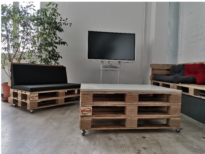
@eCom Logistik GmbH